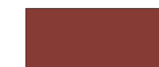
Rouge brique (59)