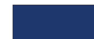
Bleu foncé (89)