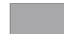
Gris pâle (20)