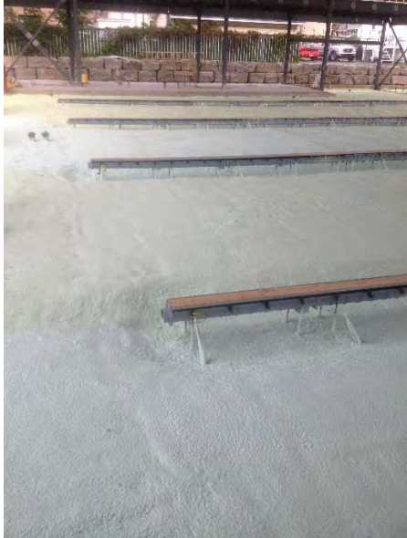
Caserne de pompier - Gatineau

De nombreux projets commerciaux tel que des casernes, entrepôts, bâtiments commerciaux, congélateurs et réfrigérateurs industriels et autres sont couramment isolés avec le produit Airmétic Soya HFO Soya.