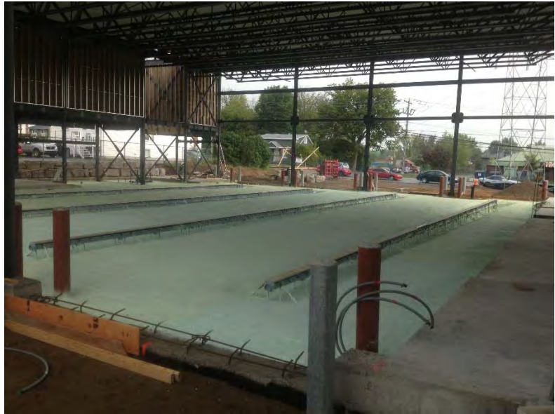
Jefo Logistique – Sainte-Hyacinthe